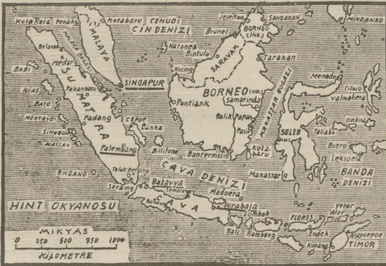
Japonların taarruz istikametleri olan Cava ve Sumatradaki Palembang şehrinin gösterir harita

Lord Aleksander Rusyaya yardım edileceğini söylemiştir.